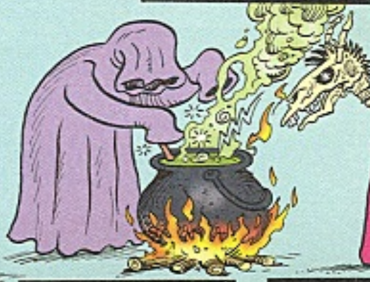
JOSEPHINA, DE GEHEIM-ZINNIGE TOVERKOL...