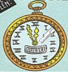
DE KLOK VAN VADERTJE TJD, DIE OP VJF VOOR TWAALF STAAT!