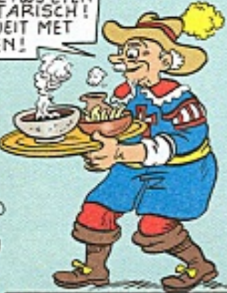
GRAAF FILEMONIUS, DE GEFLIPT DIERENVRIEND...

NEENEE! WIJ ETEN VEGETARISCH! BOEKWEIT MET LINZEN!