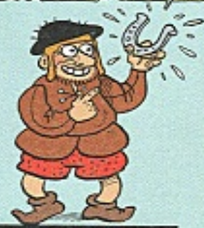
URBANUS MET EEN MIDDELEEUWSE VIDEOCASSETTE...