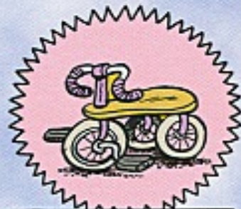
...EN HET AUTHENTIEKE DRIEWIELETTJE VAN EDDY MERCKX!!