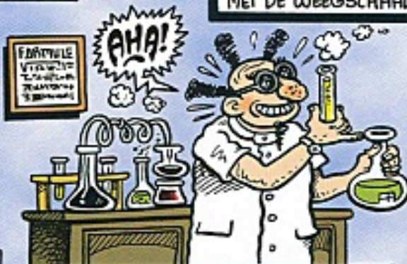
...PROFESSOR SCHRIKMERG, DIE EEN WERELDSCHOKKENDE UITVINDING DOET VAN PROVINCIAAL FORMAAT...