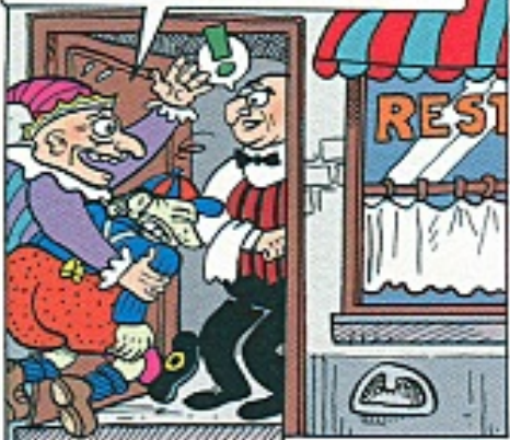
(*)LICHT GEBAKKEN, NOG BLOEDERIG.

OBER, DE GROOTSTE BIEFSTUK DIE GE IN HUIS HEBT! SEIGNANT(!!)!