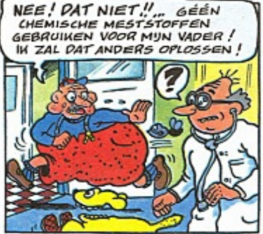
(k) ZIE: "DE LAATSTE DAGEN VAN URBANUS"

NEE! DAT NIET!!... GEEN CHEMISCHE MESTSTOFFEN GEBRUIKEN VOOR MIJN VADER! IK ZAL DAT ANDERS OPlossen!